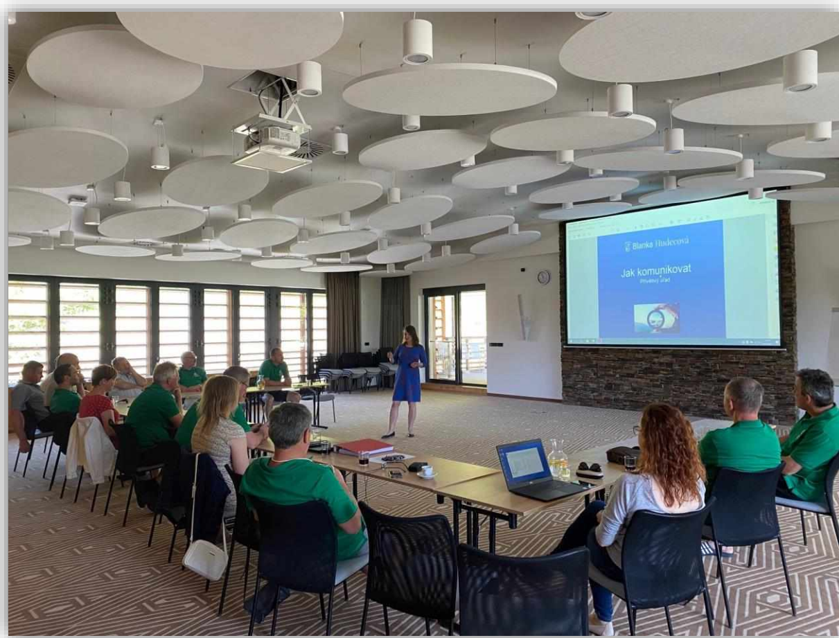
Školící prostor v Grandhotelu Tatra