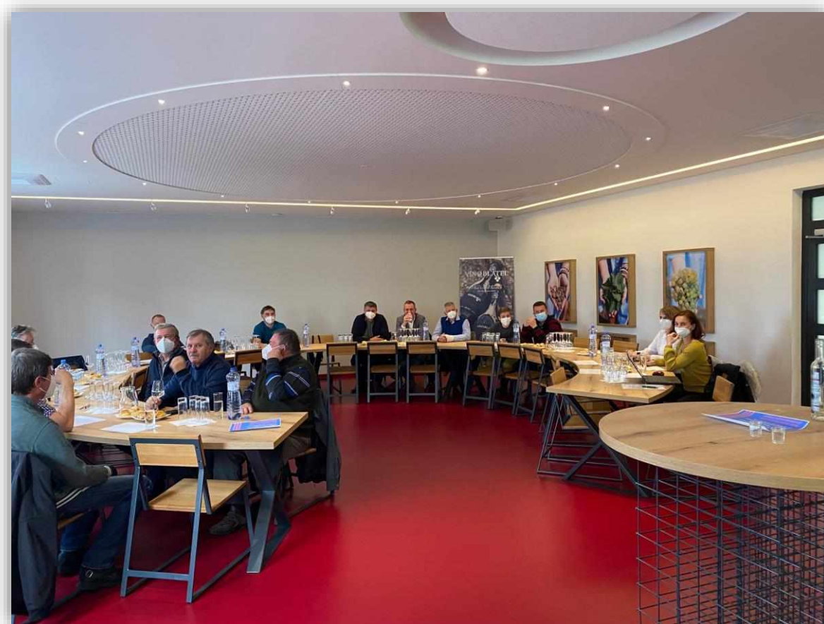
Vinotéka firmy VÍNO BLATEL, a.s.

ovocnářství a zelinářství v Jihomoravském kraji pro rok 2021“ JMK PVVOZ 2021 Smlouva č. JMK070170/21/ORR.