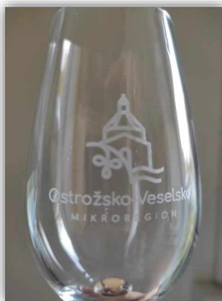
Sklenička s logem