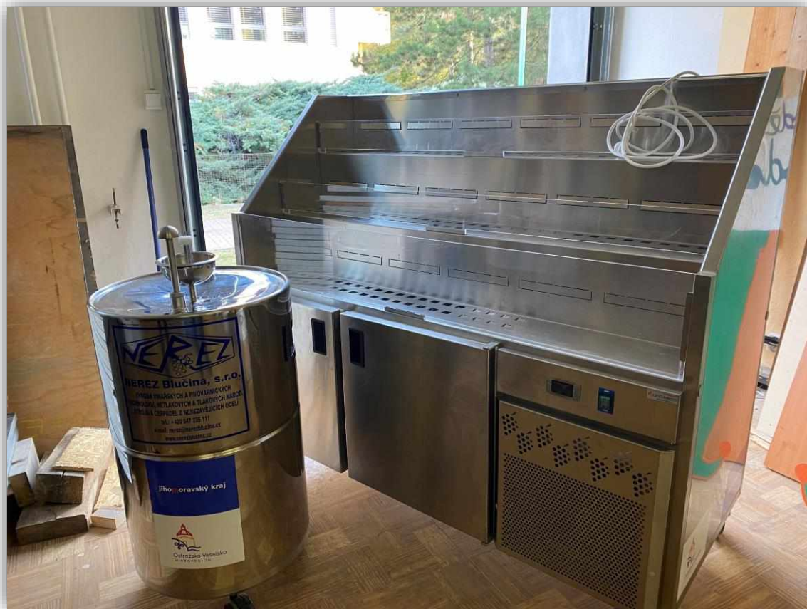
Chladicí vitrina na víno a vylachovačka skleniček