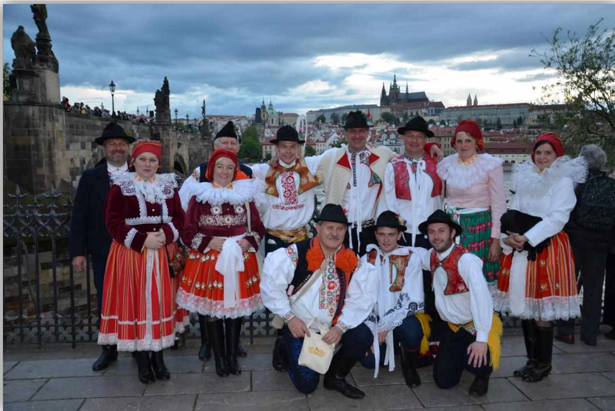
Zástupci členských obcí MOV na Navalis v Praze