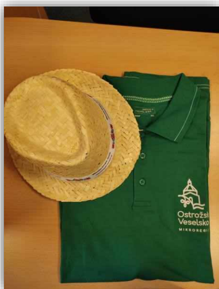
Polokošile s logem